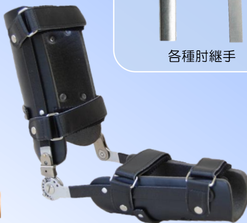
●ダイヤルロック付肘装具