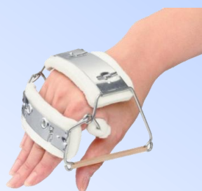
●ナックルバンダー