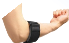
●テニスエルボー用