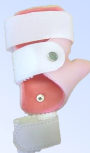
●手指伸展固定装具